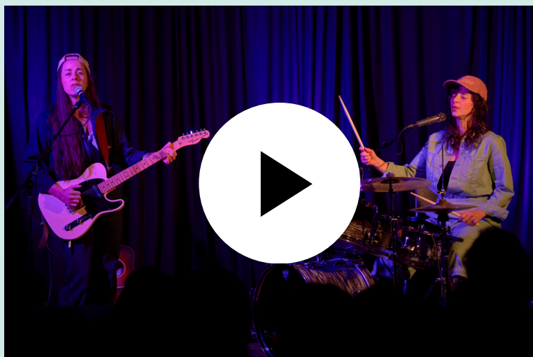
SEVEN SPANISH ANGELS